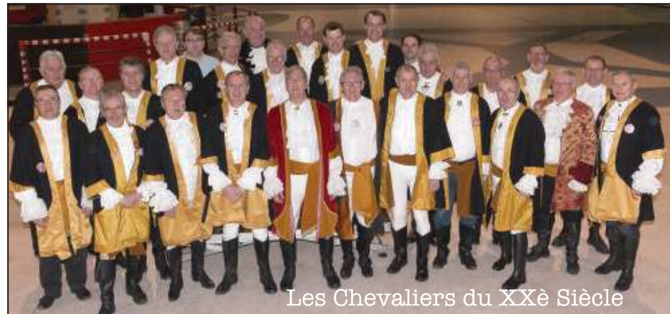
Les Chevaliers du XXè Siècle