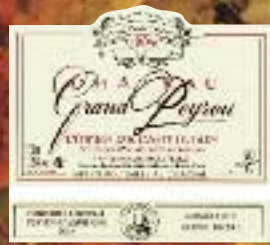
Stand 244 - GH 13 09*