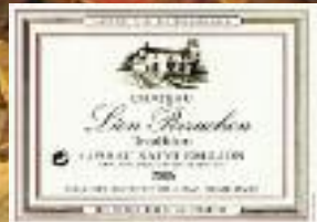
Stand 356 GH 13 09