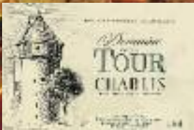
Stand 306 GH 13 10** CC