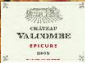
Stand 357 GH 13 11*