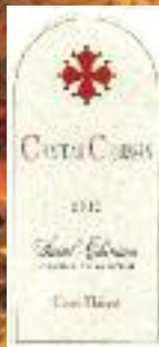
Stand 350 GH 14 12**