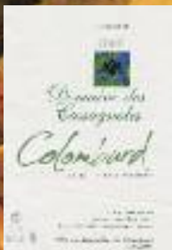
Stand 219 - GH 14 12**