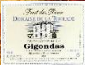
Stand 360 GH 14 11*