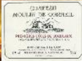
Stand 300 - GH 14 10*