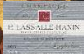
Stand 302 - GH 10*