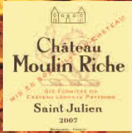
Stand 228 - GH 14 10