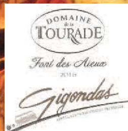
Stand 361 GH 14 11*