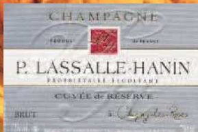
Stand 302 - GH 15 05**