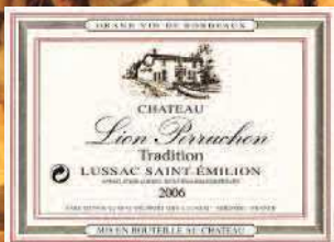
Stand 356 GH 13 09