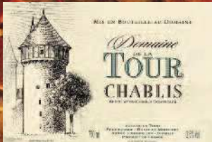
Stand 306 GH 13 10** CC