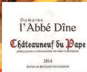
Stand 324 GH GG